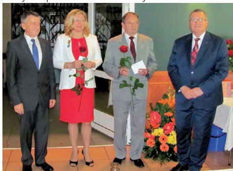
Odznaczeni „Za Zastugi dla Energetyki” oraz Prezes MPEC- Konin i Prezydent m. Konina

Coroczne święto było również okazją do odznaczenia zastużonych pracowników firmy.